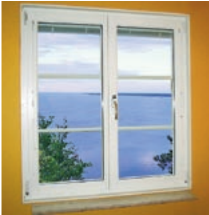
A – Kipp/Dreh-fönster i stängt läge.