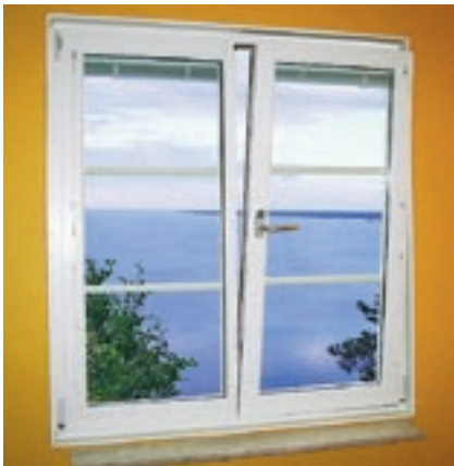
B – Kipp/Dreh-fönster i ventilationsläge.