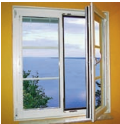
C – Kipp/Dreh-fönster i putsläge.